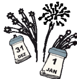
das Neue Jahr